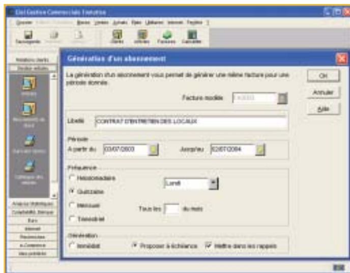
Gagnez du temps pour les factures périodiques en créant un abonnement.